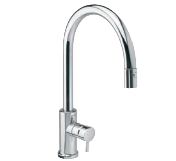
pull out Eris Køkkenbatteri – 33147 med udtrækbar spulebruser 33147.00 Krom 705747-804 33147.66 Steel 705747-816

De viste armaturer fås både til bad og køkken