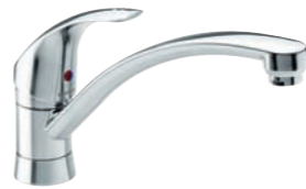
eco Jupiter Køkkenbatteri – 15047 med minibase 15047.00 Krom 705755-804 15047.66 Steel 705755-816