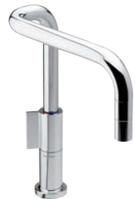
Orbix Køkkenbatteri – 35047 med minibase 35047.00 Krom 705748-804 35047.66 Steel 705748-816