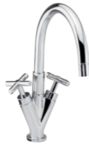
Star Køkkenbatteri – 16045 med minibase 16045.00 Krom 705520-804 16045.66 Steel 705520-816