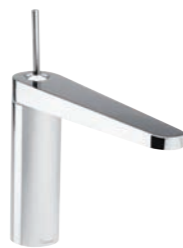
Profile Køkkenbatteri – 38047 med minibase 38047.00 Krom 705777-804 38047.66 Steel 705777-816