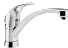
eco Saturn Køkkenbatteri 25047 med minibase: 25047.00 Krom 705770-804 25047.66 Steel 705770-816