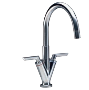
eco Venus Køkkenbatteri – 16047 med minibase 16047.00 Krom 705535-804 16047.66 Steel 705535-816